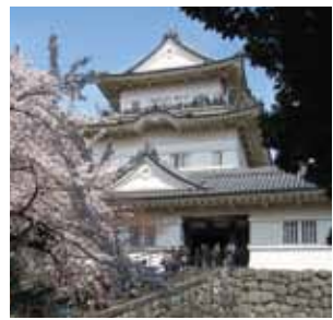
b 小田原城天守閣 15世紀の初めごろ築城したといわれ、その後戦国大名北条氏の居城となった。1960年に復元。晴れた日には、箱根の山々、相模湾などが見渡せる。