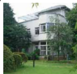
g 小田原文学館・童謡館 小田原文学館は、小田原ゆかりの文学者の資料を展示。別館の白秋童謡館は、北原白秋の童謡をテーマに、初版本や直筆原稿などを展示。