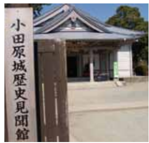
e 小田原城歴史見聞館 城址公園内にある体験型の歴史テーマ館。小田原の歴史を学びながら、江戸時代の宿場町を再現した町並みや紙芝居、人形芝居などを見学。