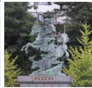
a 小田原駅前早雲像