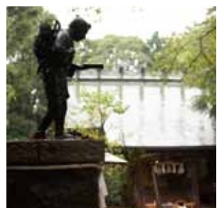
f 報徳二宮神社 二宮尊徳の「農業復興」に関する貴重な資料や年表を展示。