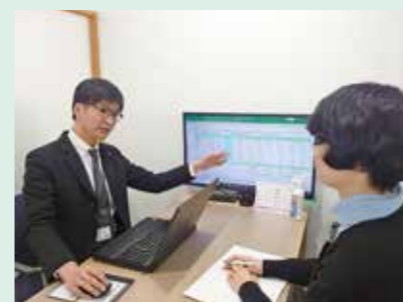
経営相談（経営支援活動）

商工会議所法に基づく認可法人であり、昭和21年に設立されて以来、当地の商工業の総合的な発展と社会一般の福祉増進を目的とし、「経営支援活動」「政策活動」「地域振興活動」の3つを中心に様々な活動を行っています。