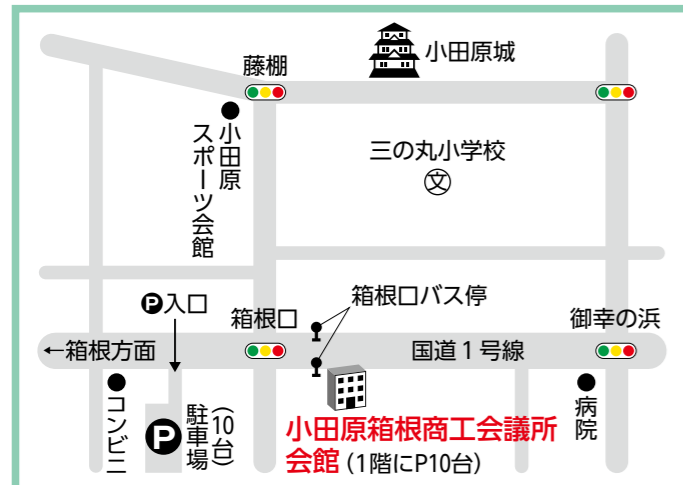
J R 東日本小田原駅より徒歩15分 専用駐車場有