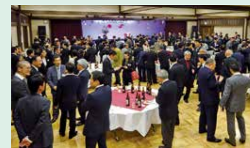
賀詞交歓会で賑わう会員交流（地域振興活動）