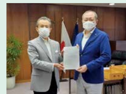
行政への要望提出（政策活動）