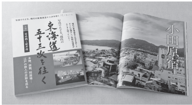
小田原宿・箱根宿の魅力も紹介されています

これは、同社発行のプレミアムムフリースモーカー「ミスモ」の人気連載、「東海道五十三次を往く」を書籍化したものです。東海道のかつての宿場町を、当時の面影や痕跡を探しながら、歴史や文化、食やお土産情報も織り交ぜて紹介しています。