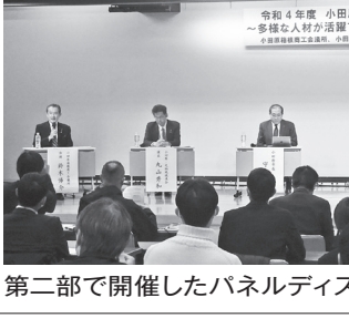
第二部で開催したパネルディスカッション

【お問合せ】 小田原市役所 戸籍住民課 マイナンバーカード担当 ☎0465(33)1384