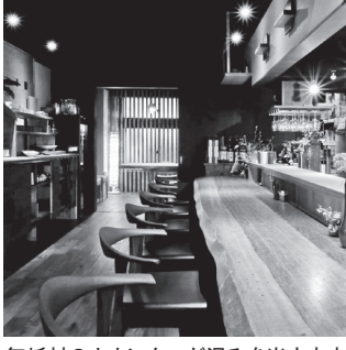
無垢材のカウンターが温みを出す店内

現在、小田原市では、公 民連携による効率的な施設 整備や運営を推進していま す。その一環として、市が 保有する遊休地などの有効 活用を進めており、「市民