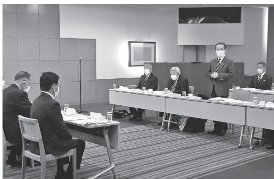
定期的に開催をしている懇談会

小田原箱根商工会議所正副会頭と小田原市長・副市長・政策監との懇談会を、昨年の12月26日(月)に報徳会館にて開催しました。こうした懇談会は、定期的に開催をしているもので、今回は、①新型コロナウイルス対策、②地域経済循環を促進するためのデジタルを