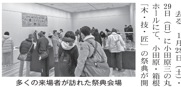
多くの来場者が訪れた祭典会場. 小田原箱根地域の木工品の魅力をPR. 去る、1月28日(土)・29日(日)に小田原三の丸ホールにて、小田原・箱根「木・技・匠」の祭典が開かれました。