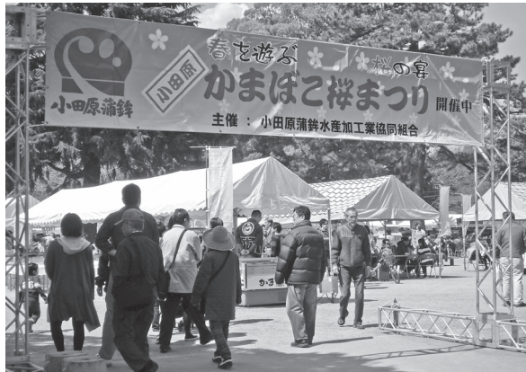
かまぼこまつり. 3月25日(土)・26日(日)開催. 会場: 小田原二の丸広場.