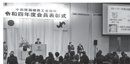
同社の担当者からその取組について説明をして頂きました

当所は、小田原箱根地域で気候変動の緩和や環境保全に関する取組に関して顕著な功績のあった企業及び団体を表彰することにより、市民、事業者等の気候変動に対する意識の向上と環境配慮活動のさらなる普及促進を図ることを目的とした顕彰事業「気候変動アワード」を実施しました。 今年5月から7月の3カ月で募集を行い、16社からご応募を頂きました。ご応募頂いた内容を選考委員会にて、「取組内容が持続的かつ発展性があること」業種や業務内容を問わず行える取組であること」等の観点から選考を行い、大賞1社、特別賞3社を選出しました。 大賞及び特別賞に選出された企業は、左記の通りです。 ◆大賞 ヤブタ塗料(株) ◆特別賞 サンネット(株) 株大平商店 株源門 なお、本誌2面にて大賞に選出されたヤブタ塗料(株)の取組内容を紹介致します。