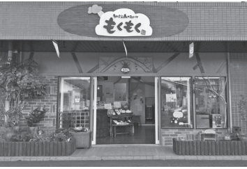
視認性の高いデザインの外観

【営業時間】 9時00分～18時00分 ※定休日 毎週木曜日 「食の安全・安心」「手作り感」を伝えるため、一点一点検品しながら手作業で包装しているため、お客様も安心してご購入いただけます。また、贈答購入の場合は、詰め合わせの相談にも対応しており、実際に詰め合わせを購入者と見合わせながら接客しているお店です。