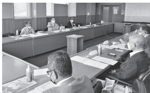
3商工会議所の会頭・専務理事で新たな取組について意見交換を実施

海からの恵みをいただく水産業の振興に併せて、海というかけがえのない地域の資源に今一度目を向け、「海を活かしたまちづくり」について考えてみるべきだと思います。さて：