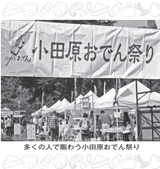
多くの人で賑わう小田原おでん祭り