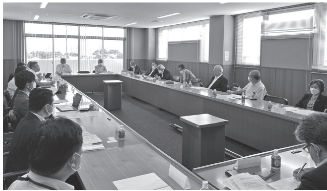
7/25に当所特別会議室で実施した懇談会

当所では、定期的に小田原市議会と市政について懇談会を実施しています。去る7月25日(月)に15時30分から17時00分まで、