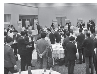
会員交流会の様子

な試みとして、参加事業所のプロフィール冊子の配布やPRコーナーを新設。今までにない活発な交流がはかられ、当所職員も仲介するなど、数多くのマッチング機会の創出につながりました。