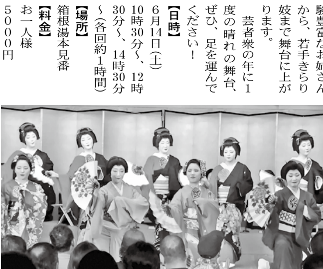
昨年の箱根をどりの様子

毎年6月に開催され、芸者衆の踊りや唄など日々のお稽古の集大成を皆様に披露する、箱根湯本芸能組合芸者衆の一大イベント。経 04660(85)5338