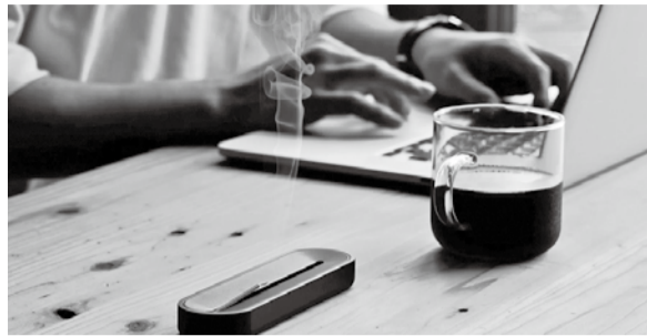
灰が落ちないお香立て

OMIDTOWN AWARD 2022」での優秀受賞だ。この受賞をきっかけに、「僕たちは良い意味で凡人だから、気取った自己満足な商品開発はやめよう」という想いを明確にし、「Creative unit bon.」という名前とその意思を込めた。創業にあたっては、小田原箱根商工会議所にも相談補助金の申請や事業計画書作成のサポートを受けたほか、同商工会議所が主催する起業スクールも受講し卒業した。「創業に必要な知識や出会いがあったことが、今の自分たちにとって大きな財産になった」と振り返る。