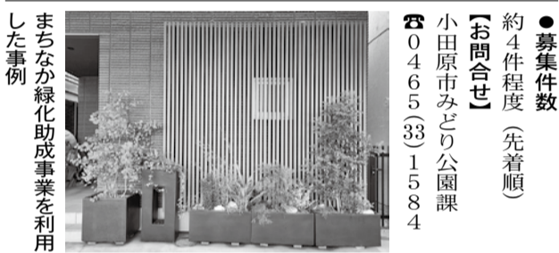
まちなか緑化助成事業を利用した事例

●助成金額 緑化対象経費の2分の1(ただし、15万円を上限) ●対象 緑被率の低い小田原駅周辺の一「まちなか緑化推進エリア」内の道路に沿った地上部分の緑化、公共の場から見える壁面の緑化、一般に公開されている屋上の緑化 ●最低面積 1平方メートル以上 ●受付期間 令和8年1月末日