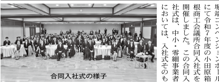
合同入社式の様子

令和7年度 2025年度 定期健康診断の実施について 今年度の小田原箱根商工会議所による定期健康診断は、小田原卸商業団地協同組合と箱根町仙石原文化センターについては、J.A.神奈川県厚生連による巡回健診の実施をします。