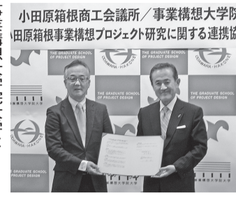
小田原箱根商工会議所/事業構想大学 田原箱根事業構想プロジェクト研究に関する連携協定調印式

今年10月から、当所では、事業構想大学院大学との共催で「小田原箱根事業構想プロジェクト研究」を開講します。